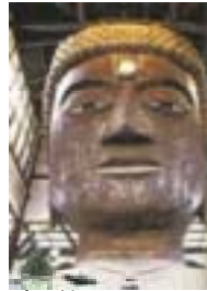
り(1973年(昭28)4代目の 木造大仏も火災で焼落ち今は 無い。今、正面通り呼ぶ通り の名は大仏殿の正面。西の門 が有った辺りには「西の門町」 名で残ってい る。又、三十 三間堂南大門 と築地塀通称 「太閤塀」(桃 山時代造営。 重文)も秀 吉公が寄進で 瓦に五山の三 の桐の家紋が 入っている。 方広寺は天台 宗山門派の寺 で創建1595年(文禄4)開基 は豊臣秀吉公である。秀吉公

には、豊臣秀吉公所縁の場所 が二つ並んでいる。その一つ は今の博物館敷地も含めた大 大な地に1586年(天正14)秀 吉公が奈良の東大寺大仏より 大きな大仏と大仏殿建立であ る。大仏 と大仏殿 は、その 後幾度も 火災にな