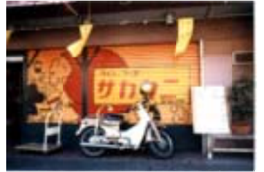
美大生の協力で絵を書いたシャッター

受けて貰い、国金の借入も出来て現在地移転、店舗改装して「ワイン&フーズ・サカタニ」を更に翌年一月、家内名義で「立ち飲み酒処サカタニ」を開業しました。(酒屋と飲食店は併業不可) 第一次石油ショックの幸運で前会社から引継いだ得意先は納入価格値上げに応じて下さり取引も継続出来ました。「ワンツウ事務所」で地域のお客様の支持がふえました。「立ち飲み酒処」も月曜、金曜、五時〜八時の短時間営業でしたが繁盛しました。両方合わせると3年間で売上は三倍増しました。