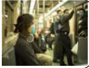
メキシコシティ電車内にて感染予防のためにマスクを着用する人々

太平洋の遙か彼方、メキシコの「豚インフルエンザ」の左の写真を他人の様に見ていたら今や日本でも普通に見られる風景に成った。 メキシコからシカゴにとんだ「ウィルス」は、他の生物は修学旅行生を通して日本に持ち込まれ、その他のルートでも入り広がった。そして昨日(5/22)京都でも感染者がでた。ファミマのマスクも瞬時に品切れ、入荷も極僅か。ネットでは超高額なマスクが売られている。