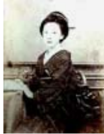
坂本龍馬の妻 おりょうの写真

別に紹介もしていますが、6月21日開催第54回「朝粥を食べておしゃべり会(予約制)」では京都博物館の学芸部考古室長宮川禎一様に「坂本龍馬の悩み」と題したお話を頂戴します。そこで参考にホームページで検索した関連記事、写真を次の「」内に転載して紹介します。