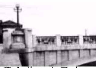
欄干は戦前前の写真、金属製の欄干は戦

りとした貫禄。重厚な橋の姿に圧倒されるだろう。 橋脚は鉄筋コンクリートアーチ型。本体設計は柴田畦作東大教授、意匠設計森山松之助、山口孝吉(技術者)で明治末期の三大事業計画(道路拡幅、市営電