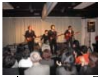
12月2日「楽々ホールで開催したチャダンゴライブの会場写真」