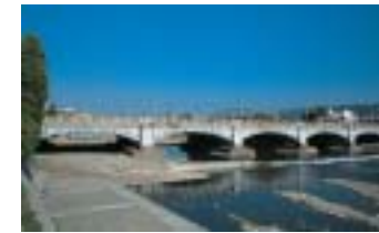
七条大橋(大正2年完成)は鴨川に架かる橋として現存の橋では最古。鴨川へ下りて橋を見上げる大正2年完成の七条大橋。大正2年完成の七条大橋。大正2年完成の七条大橋。

11月号で記しましたが、三条延長大成功でした。1912(大正元)年8月開通の京津電車と連絡し、急行列車の終日運転は乗客の大幅増加がみられました。 1両で走っていた急行は66(昭和元)年末には2両連結となり、翌年には日本で初めてのロマンスカー運転となりました。 ところが五条〜三条間の電車による営業権は京都市保有、という泣きどころがありました。 その権利を京阪は借用して線路を延ばしたのですが、借用期限は66年10月27日迄で、五条〜三条間が走れなくなれば商売として成り立ちません。 この問題で京阪がやきもきして