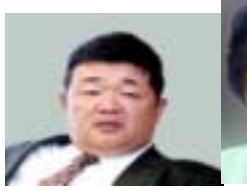
(有名につき写真の説明は略す)